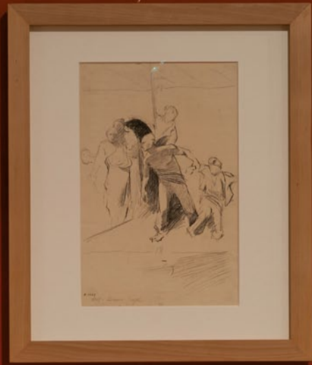
Study for 'The Descent from the Cross', 1868-70 Charcoal on paper 18 x 24 cm MEAM