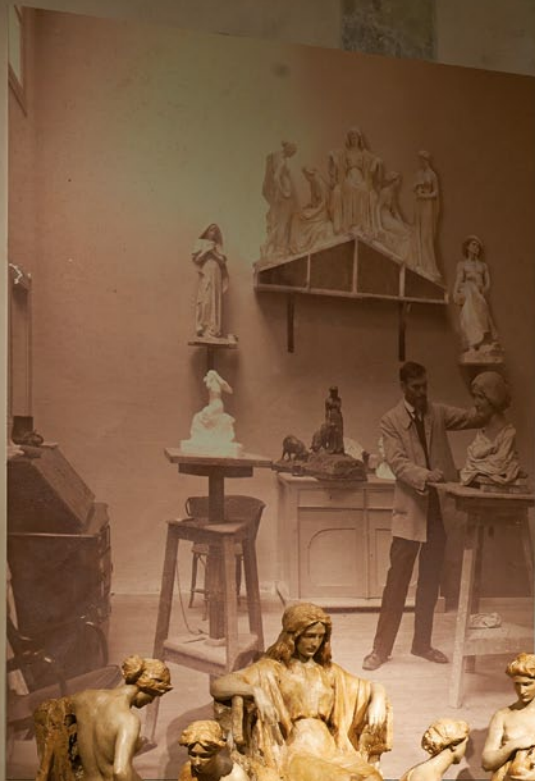
Sala Duig i Cadafalch