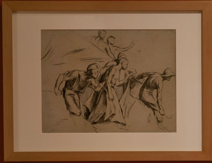
Study for 'The Descent from the Cross', 1868-70 Charcoal on paper 18 x 24 cm MEAM