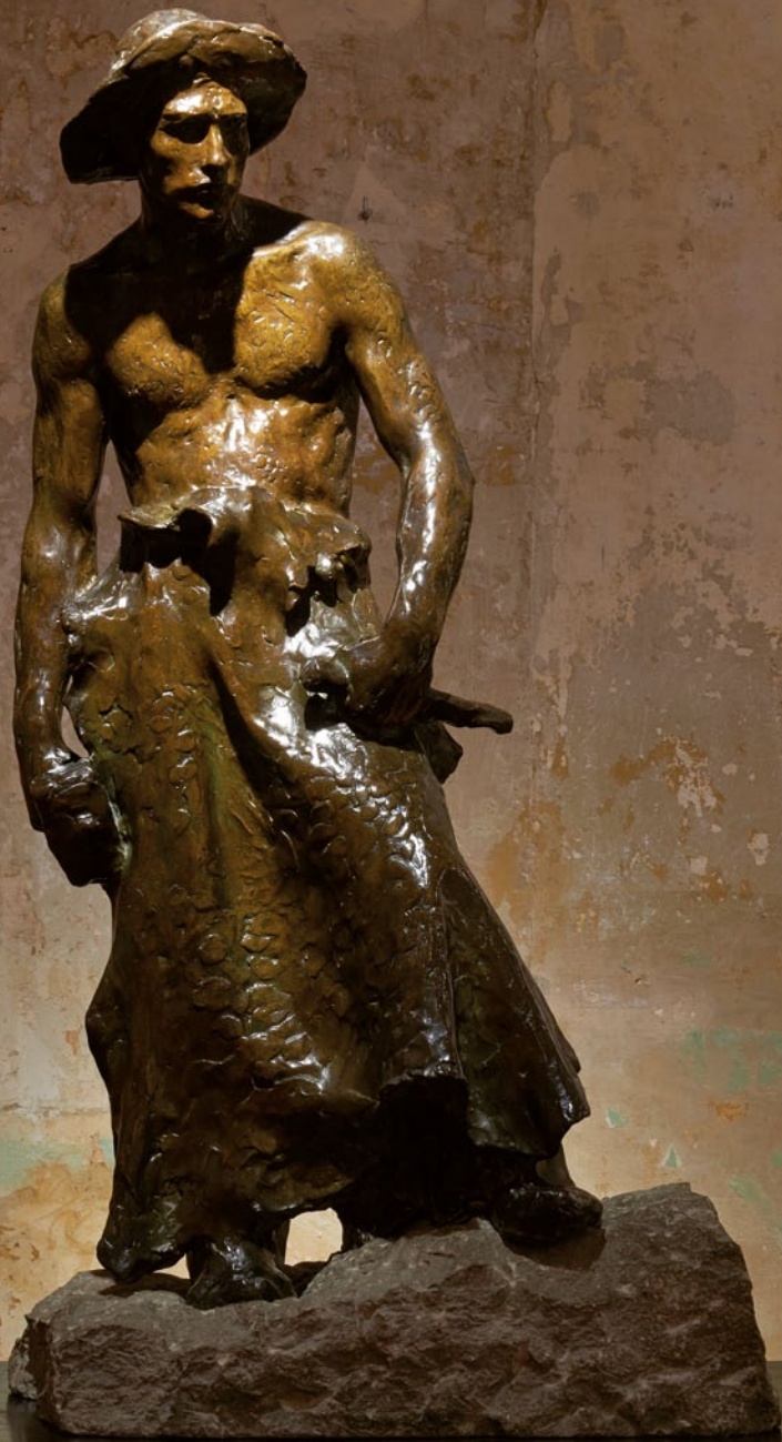
Man in Hat (1905) by August Rodin