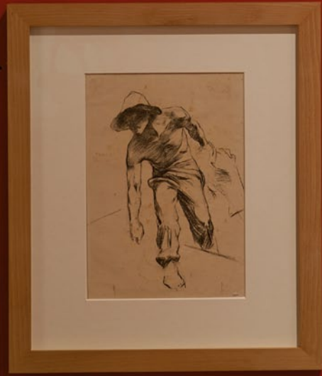
Study for 'The Descent from the Cross', 1868-70 Charcoal on paper 18 x 24 cm MEAM