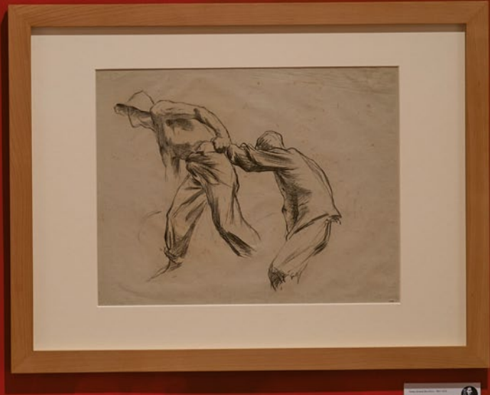
Study for 'The Descent from the Cross', 1868-70 Charcoal on paper 18 x 24 cm MEAM