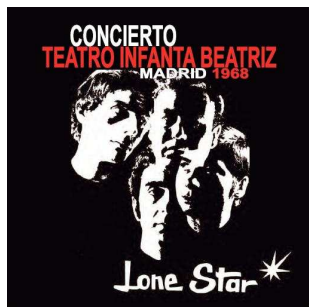
Portada del CD