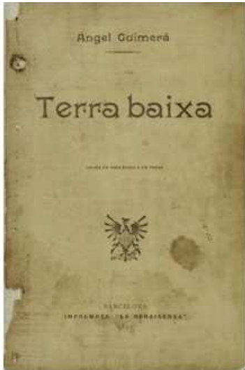
Biblioteca de Catalunya