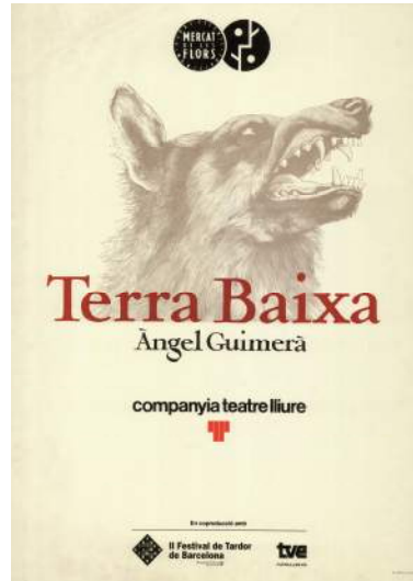
Cartell de Cesc Espluga per la producció del Teatre Lliure de la Temporada 1990