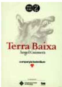
Cartell de Cesc Espluga

Terra baixa, producció del Teatre Lliure de la Temporada 1990-91