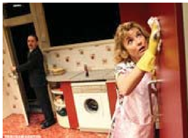
Garrick Theater, 2007

Un món on es descriu l'enfrontament de classes a partir de l'ascens de l'ambició Hopcroft i la caiguda dels seus dos amics amb un humor cruel i mordaç.