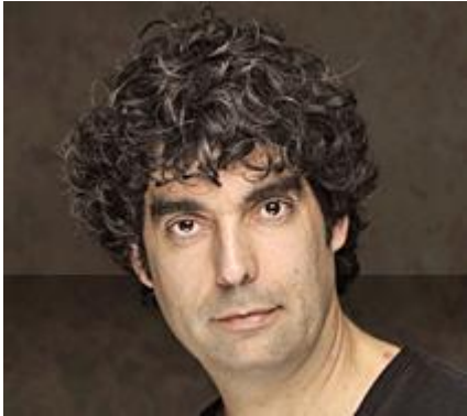
Figueres (Girona), 1969